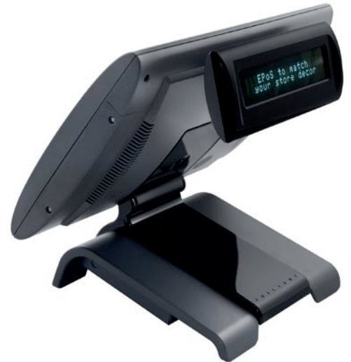
avec afficheur client